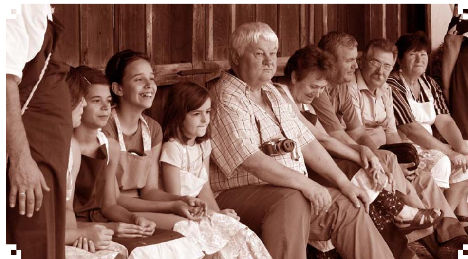
Köténykötés után - pillanatkép a 2010-es táborból